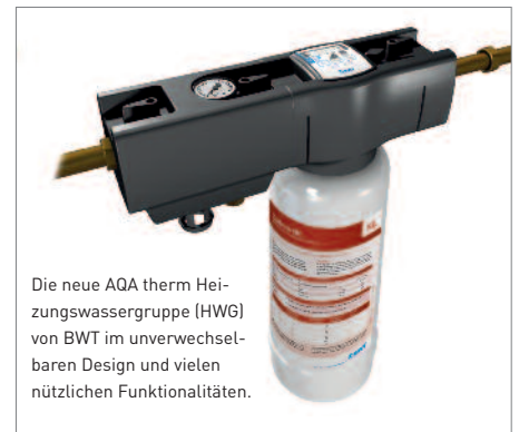
Die neue AQA therm Heizungswassergruppe (HWG) von BWT im unverwechselbaren Design und vielen nützlichen Funktionalitäten.

Ohne Kalk und Schlamm heizt es sich günstiger. Das BWT ReinHEIZgebot ist die richtige Lösung für diese Notwendigkeit. Mit Hilfe der perfekt aufeinander abgestimmten AQA therm-Produkte wird das Füll- und Ergänzungswasser entsalzt bzw. enthärtet, wie es vom Gesetzgeber vorgeschrieben ist. BWT AQA therm vermeidet Störungen durch Kalkherde, Schlammansammlungen und mitgeführte Luft in der Anlage. Das spart Heizkosten, bringt Ruhe ins Haus und sorgt für eine reibungslose Funktion der Heizung.